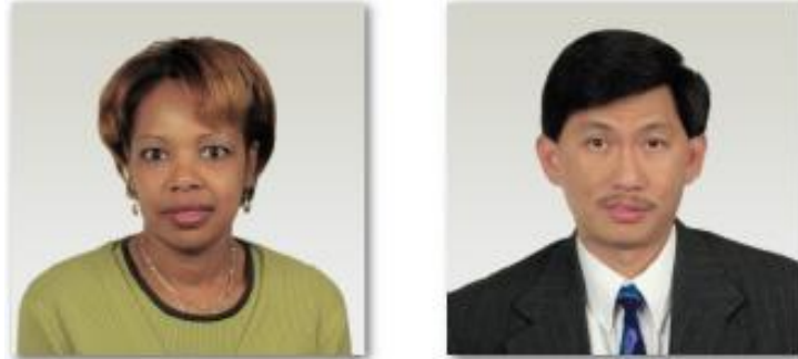
사진 품질기준 - 기술적 조건